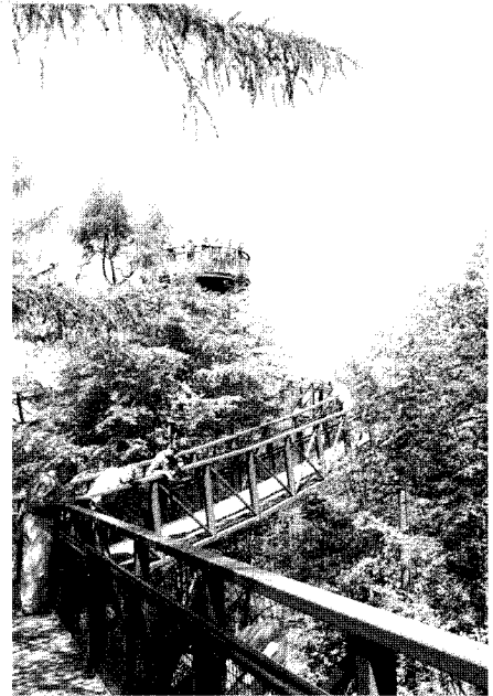
Boomkroonpad: voorbeeld van een innovatief project

Staatsbosbeheer bijvoorbeeld brengt met het Boomkroonpad een nieuwe toeristenattractie. De agrarische sector komt met zaken als 'logeren bij de boer'. Meubelboulevards ontwikkelen zich tot toeristische attracties. Steeds meer activiteiten blijken toeristisch potentieel te herbergen en worden daarvoor aangeboord. Het aanbod voor de consument breidt zich dus met de dag uit, omdat, zoals gezegd, innovativiteit van groot belang is voor de aanbieders op de drukke vrijetijdsmarkt. Globalisering maakt dat de concurrentie uit het buitenland toeneemt. Landen, regio's en bedrijven worden wereldwijd tegen elkaar uitgespeeld. Het aantal distributie- en informatiekanaal groeit, mede door de beschikbare informatie- en communicatie-technologie. Het gebruik van nieuwe media, zoals internet, e-commerce en elektronische distri-